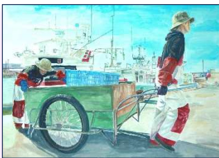
↑〇〇央さんの作品 (佳作)